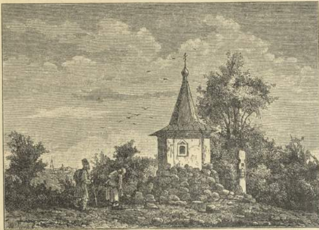
Рис. 1. Часовня въ 2 в. отъ Костромы у Святого озера, по преданію близъ мѣста, гибели татаръ; при нашествіи ихъ на Кострому въ 1241 г.

четыре палатки. На возобновленіе церкви послѣ пожара по указу императрицы Екатерины выдано было 12,000 р. Соборъ передѣланъ въ 1843 г.