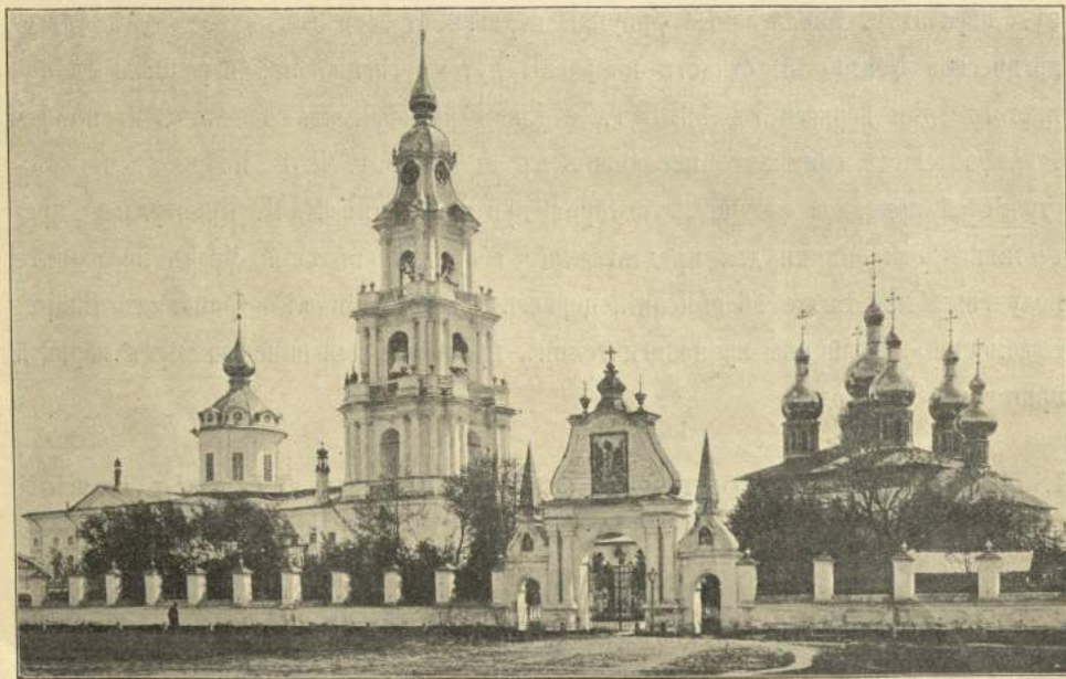
Рис. 2. Кострома. Успенскій соборъ и Богоявленская церковь, XIII—XVIII в.

Размѣры храма: вышина 17 саж., длина 11\frac{1}{2} саж., ширина 8\frac{1}{2} саж. Своды коробовые, полуциркульные, образующіе собою подобіе креста и покоящіеся