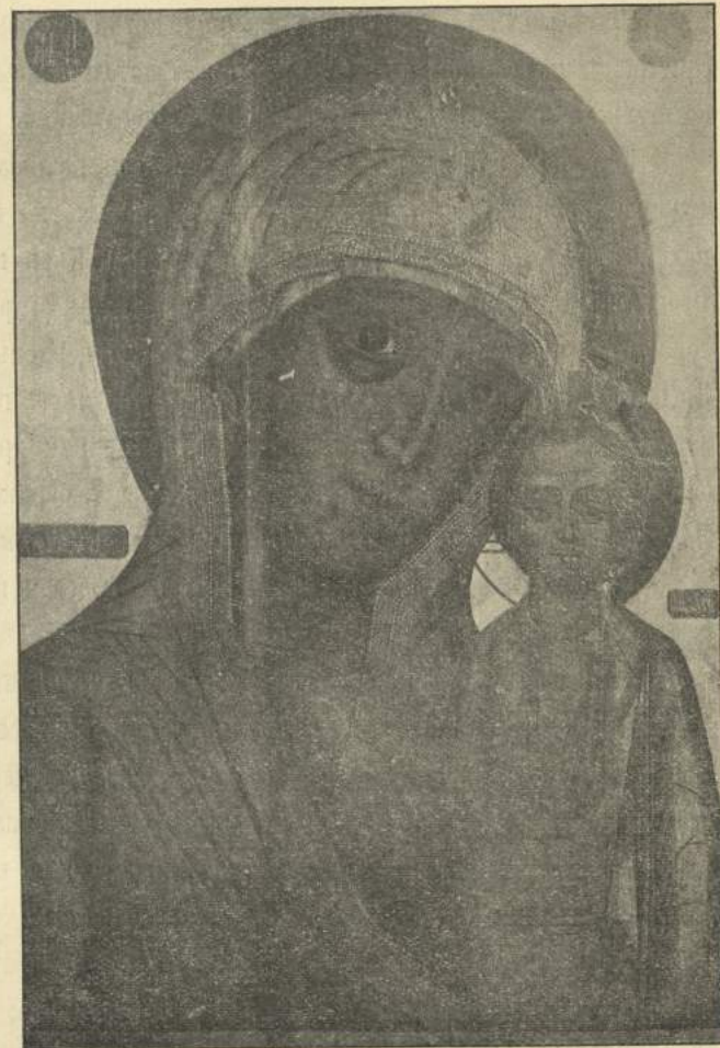
Рис. 6 Кострома. Успенскій соборъ. Вкладъ царя Михаила Феодоровича.

Иконостасъ въ два яруса новаго устройства съ витыми колоннами, пилястрами, карнизами и рѣзбою, помѣщенною на золотомъ полѣ. Въ нижнемъ ярусѣ, кромѣ мѣстныхъ иконъ, есть два ряда мелкихъ иконъ овальной формы. На верху иконостаса выдаются такія же иконы въ рѣзныхъ украшеніяхъ. Иконы стараго русскаго письма; изъ нихъ, кромѣ чудотворной, замѣчательны: икона на св. Іоанна Бого-