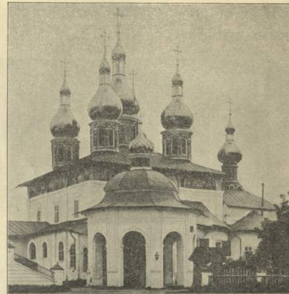
Рис. 3. Кострома. Успенскій соборъ.

Стѣны выложены изъ тяжелѣснаго (20—21 фунт.) кирпича. Наружныя стѣны гладкія. На нихъ есть выдающіяся лопатки, по четыре на каждой сторонѣ; лопатки, не доходя до верха, упираются въ карнизъ; надъ карнизомъ расположены три закомары съ углубленіями. Между абсидами алтаря есть выдающіяся равныя лопатки. На восточной сторонѣ обведенъ тройной круглый поясъ съ отливомъ отъ верха въ