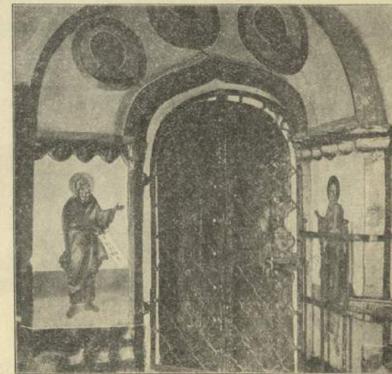
Рис. 4. Кострома. Успенскій соборъ. Обрамленіе портала заштукатурено.