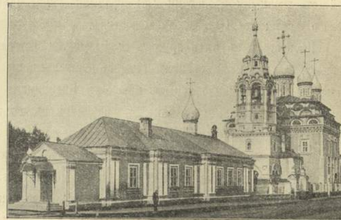
Рис. 7. Кострома. Троицкая церковь, 1645 и 1786 г.

Стѣны выложены сплошною кладкой изъ толстаго, продолговатаго, тяжеловѣснаго (болѣе 18 фун.) кирпича. Наружныя стѣны на церкви гладкія, на колокольнѣ съ украшеніями. На углахъ храма поставлены гладкія полуколонки;